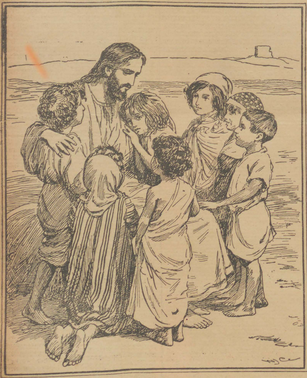
DITAROEHNJA TANGAN DIATAS KEPALANJA AKAN MEMBERKATI DIA-ORANG.