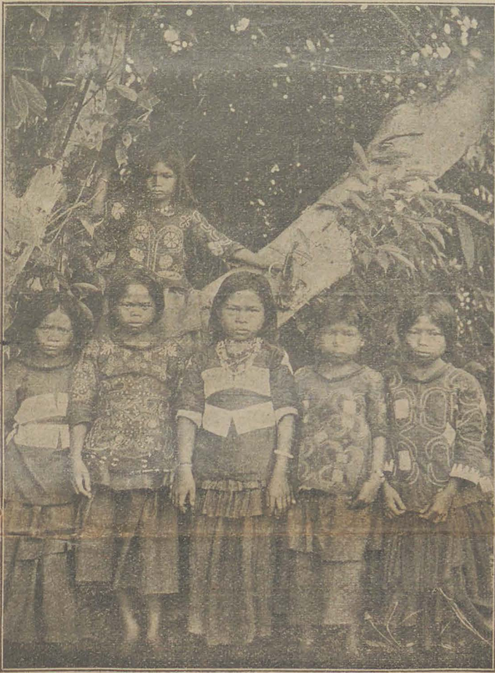
Zes meisjes van Palolo. (Midden-Celebes.)